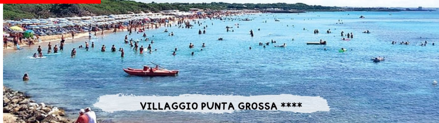
VILLAGGIO PUNTA GROSSA ****