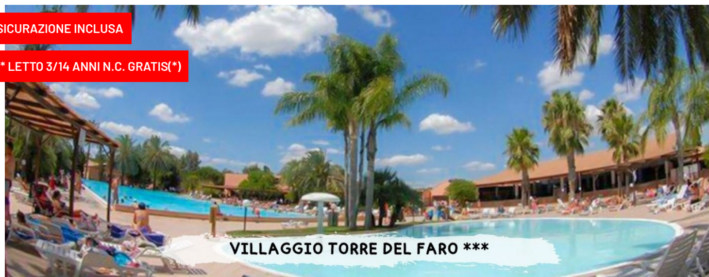
VILLAGGIO TORRE DEL FARO ***

quote a persona in pensione completa - bevande incluse in formula "mondotondo club"