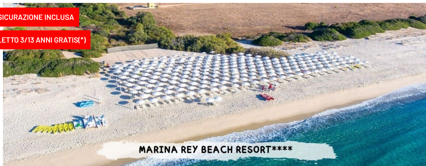
MARINA REY BEACH RESORT****