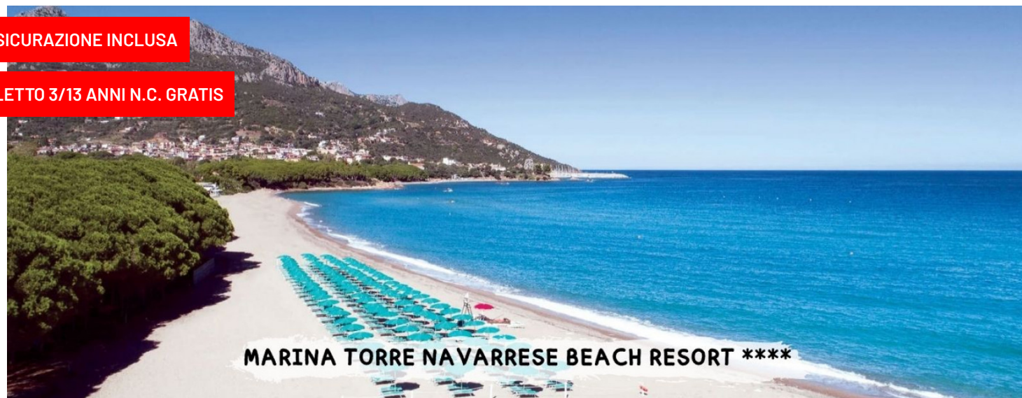
MARINA TORRE NAVARRESE BEACH RESORT ****